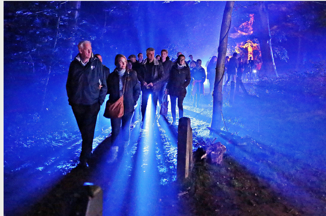
Operatie IJsellinie, 2017

nationale uitstraling. In deze organische volgorde willen we blijven werken: eerst de provincie bedienen en dan het hele land.